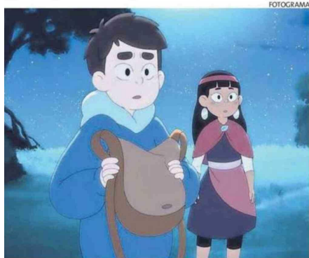
LA PELÍCULA ANIMADA "NAHUEL Y EL LIBRO MÁGICO".

Las entradas, disponibles a través del sitio tuacceso.cl, tienen un valor general de $15.000 hasta el sábado, y de $20.000 en puerta. Asimismo, en el sitio hay un link para quienes deseen hacer sus aportes a través del Hogar de Cristo o de Techo Chile. ☺