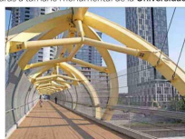
Puente de luz, Toronto.