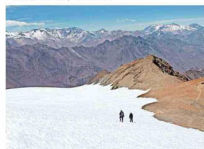
Camino a la cumbre de El Plomo.