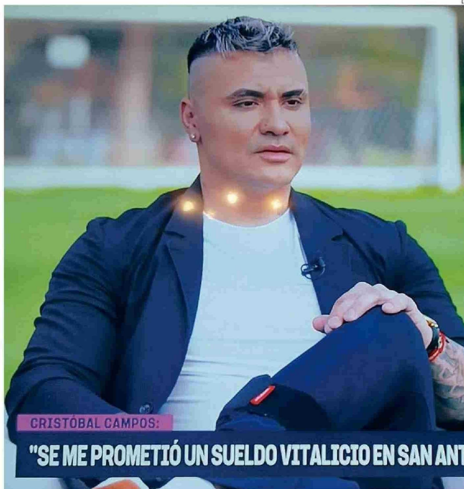
LA ENTREVISTA SE REALIZÓ EN UNA DE LAS CANCHAS DEL COMPLEJO DEL SINDICATO DE FUTBOLISTAS PROFESIONALES.

"(Fue) un momento muy difícil que me ha marcado hasta el día de hoy. Venía arrastrando una depresión y, clara-