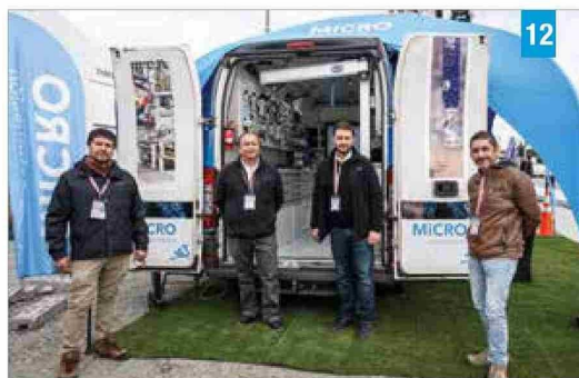
Foto 12: Micro Automación participó con su equipo en un stand exterior.