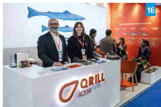
Foto 16: Qrill Aqua participó con un stand enfocado en la interacción con asistentes.