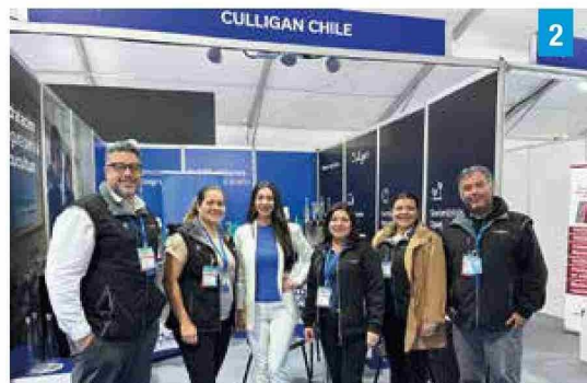
Foto 2: Representantes de Culligan posan en su espacio de exhibición.