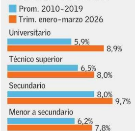
Tasa de desempleo según máximo nivel educativo terminado