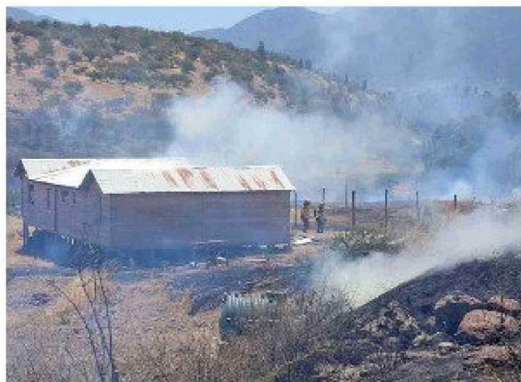
Durante el periodo 2023-24 en la Región de O'Higgins se registraron 332 incendios forestales.

En el caso de la Provincia de Colchagua, la medida de prohibición comenzó este mes y se extiende hasta abril en las comunas de Pumanque y Lolol, mientras que en San Fernando, Chimbarongo, Placilla, Palmilla, Peralillo, Nancagua y Santa Cruz, las quemas estarán