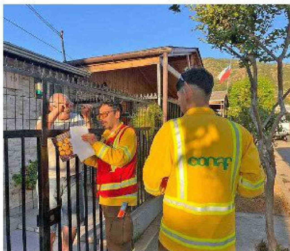
Desde Conaf han realizado un trabajo de concientización y prevención de incendios forestales.

de la región, no sólo responde el Cuerpo de Bomberos local, llegando también la fuerza de tarea con carros bombas forestales y cisterna, con el fin de extinguir con mayor rapidez el incendio. Agregó que como región existe una gran coordinación a través de Senapred, que ha permitido que las instituciones se conozcan no sólo por la marca institucional, ya que la idea es conocer quienes las lideran para, a través de una llamada telefónica, activar protocolos y poder movilizar rápidamente recursos a cualquier punto de la región. Estos protocolos de respuesta rápida se han visto perfeccionados en bomberos, ya que Fabia recordó que la temporada pasada hubo afectación de más de 10 mil hectáreas, lo que produjo un desgaste de material y personal, así como recordó que hubo afectación de 85 viviendas, pero sin ninguna víctima que lamentar. El no haber tenido víctimas es algo que destaca la autoridad bombe-