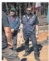
El Mandatario en Concepción.