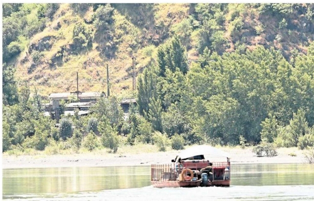
La única posibilidad de cruzar el río entre Santa Juana y San Rosendo es en balsa. Ambas comunas esperan el puente Amdel.

Tiraje: 10.000 Lectoría: 30.000 Favorabilidad: No Definida