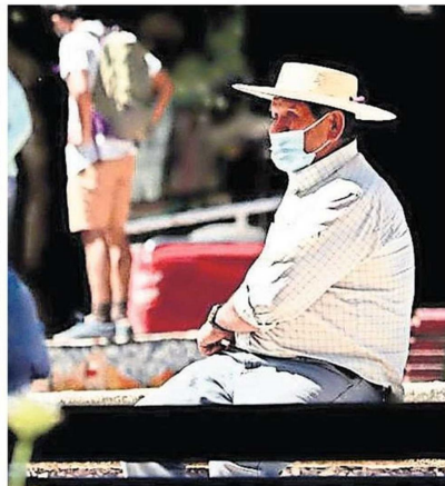
El 18% de la población de Hualqui vive en sectores rurales.

Biobío es el segundo territorio del país con más comunas en esta condición