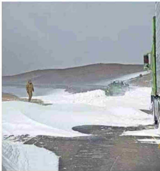
CONDICIONES CLIMÁTICAS EXTREMAS SE REGISTRARON EN LA FRONTERA.