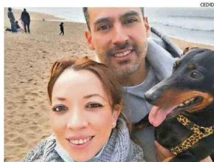
El matrimonio dice que la perrita no ha vuelto a ser la misma.

trastorno sensorial, desesperado porque no sabía dónde estaba la Kissie, a lo que me respondió: 'No puedo'".