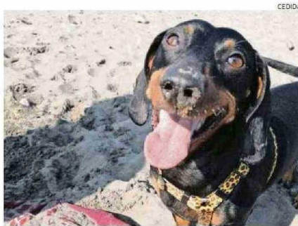
Kissie estuvo 14 horas dentro de un avión sin agua ni comida.