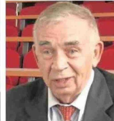
EKIMOV OBSERVÓ POR PRIMERA VEZ LOS PUNTOS CUÁNTICOS.