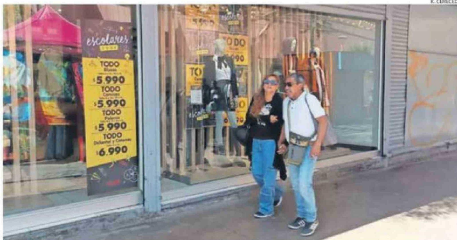
LAS VITRINAS DE VARIAS TIENDAS DEL COMERCIO CALAMEÑO YA LUCEN LOS UNIFORMES ESCOLARES PARA ESTE AÑO LECTIVO.

Karen Elena Cereceda Ramos karen.cereceda@mercuriocalama.cl