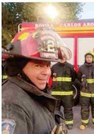
El Comandante de Bomberos, Osvaldo González San Francisco.

El proceso formativo de un bombero comienza en la infancia o adolescencia como cadete, luego, al cumplir los 17 años, pasan a ser aspirantes. "En esa etapa deben realizar cursos, tanto a nivel local como en la Academia Nacional de Bomberos. Recién después, si cumplen con los requisitos, se convierten en voluntarios", detalla el comandante.