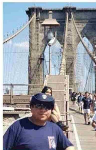
En el Puente de Brooklyn, Nueva York, Estados Unidos.