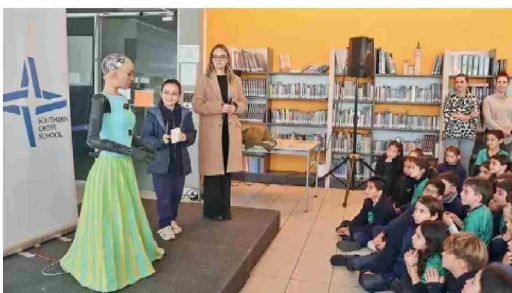
RIA en Southern Cross School.