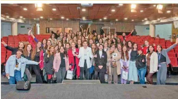
Mujeres profesionales y emprendedoras en Her Global Impact Summit.