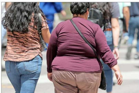
Según las últimas estadísticas oficiales, antes de la pandemia, un tercio de los adultos en Chile tenía obesidad.

“La pandemia fue una situación en la cual se agravó la obesidad en el país y de un sinfín de otras enfermedades, y muchas que se relacionan entre sí”.