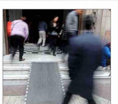
EXIGENCIA. — La rampa debe tener una pendiente que permita el uso autónomo, sin riesgo de volcamiento.

PATRIMONIALES En los inmuebles definidos como áreas de protección de recursos de valor patrimonial cultural, la DOM podrá —previa solicitud fundada del propietario— autorizar excepciones a las disposiciones legales. Dicha solicitud deberá fundarse en aspectos estructurales, constructivos o que afecten su valor patrimonial cultural.