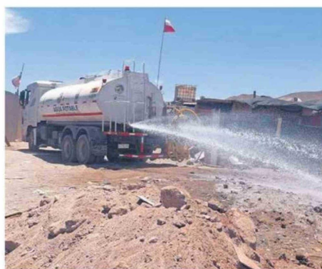
MUNICIPIO ACUDIÓ AL LUGAR PARA ROCIARLO CON AGUA

tuación se agrava y se vuelve peligrosa, no solo por la posible propagación del fuego hacia viviendas cercanas, sino también por el impacto en la salud de las personas. Hace pocas semanas se registró un siniestro que fue controlado, pero algunos focos se han reactivado, generando una constante emanación de humo tóxico", señaló.