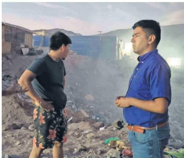
OLORES EMANAN DESDE BASURAL UBICADO A POCOS METROS DE VIVIENDAS

Tiraje: 9.500 Lectoría: 28.500 Favorabilidad: No Definida