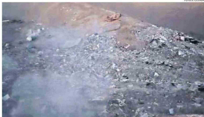
CONSTANTEMENTE SE PRODUCEN INCENDIOS EN ESTOS VERTEDEROS CLANDESTINOS

"Los malos olores son permanentes debido a la presencia de microbasurales; sin embargo, cuando estos se incendian, la si-