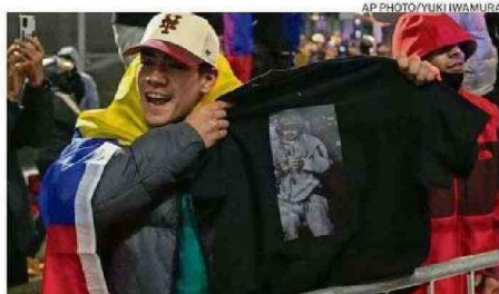
Las protestas a favor y en contra de lo ocurrido se mantuvieron ayer.

Luego el propio Trump se refirió a la decisión de mantener a Delsy Rodríguez, pero lo hizo con una amenaza. "Si no hace lo correcto, pagará un precio muy alto, probablemente mayor que Maduro", dijo a The Atlantic.