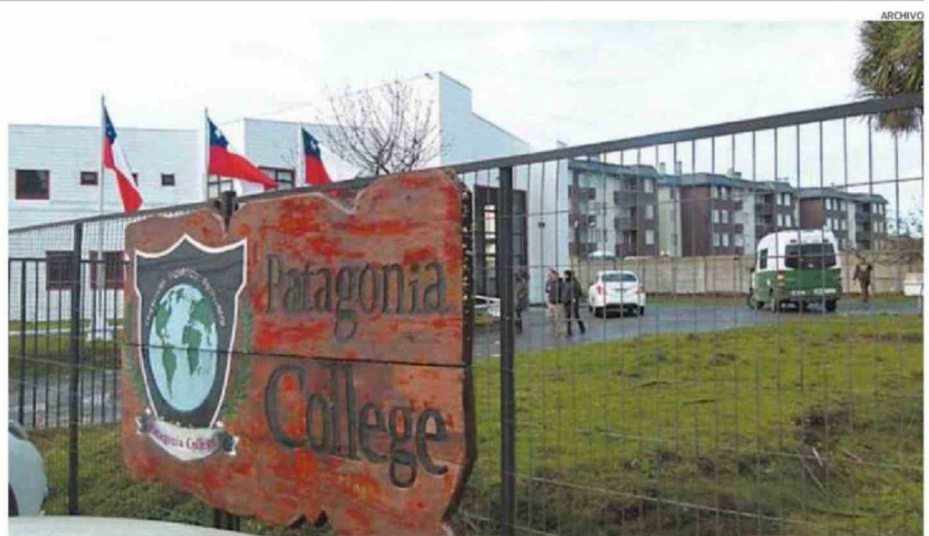
HACE SIETE AÑOS SE REGISTRÓ UN GRAVE EPISODIO DE VIOLENCIA ESCOLAR EN EL PATAGONIA COLLEGE DE LA CAPITAL REGIONAL.

En Puerto Montt, el Daem implementó el programa "Comunidades Libres de Violencia" en sus 75 establecimientos, también en respuesta a los hechos ocurridos en Calama. El