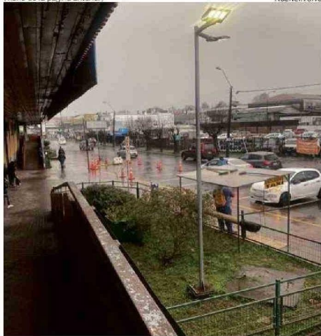
EL TERMINAL ESTÁ LEJOS DE SER MODERNO, BONITO Y FUNCIONAL.

(actualmente tiene 1.891 metros cuadrados), con 69 estacionamientos subterráneos y 50 locales comerciales al interior del edificio. Ahora, esto sin analizar otro tipo de actividades que podrían funcionar de forma complementaria, como un supermercado, gimnasio o un mall. Esto está proyectado al crecimiento futuro y el estudio evidencia una expansión de lo que actualmente hay", explicó Vidal.