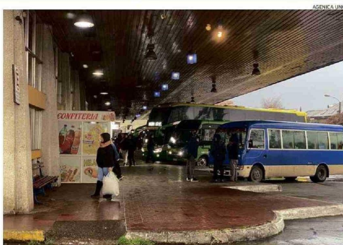
LAS FALENCIAS SON VARIADAS EN EL TERMINAL MUNICIPAL Y HAY CONSTANTES CRÍTICAS DE LOS USUARIOS.