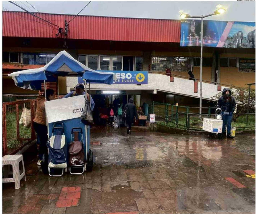
EN LA IMAGEN SE APRECIA LO DESCUIDADO DE LA FACHADA E INGRESO AL TERMINAL, LO QUE EVIDENCIA LOS 40 AÑOS DE ANTIGÜEDAD DEL RECINTO.

anteproyecto para concretarse en el mismo terreno municipal donde se ubica el rodoviario desde 1974, entre las calles Los Carrera y Errázuriz. La propuesta base considera una superficie de 8.728 metros cuadrados disponibles (abarcando una extensión hasta calle Angulo), con un edificio de 2 pisos con locales comerciales, boleterías, restaurantes, loza para andenes, planta subterránea para estacionamientos, entre otros.