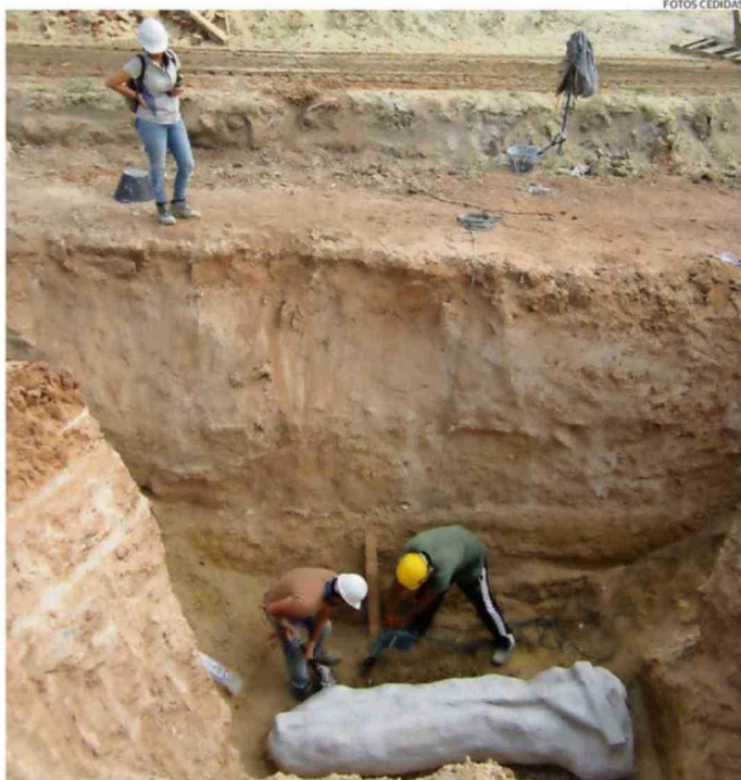
La investigación usó antecedentes de monitoreos a obras en Coquimbo.