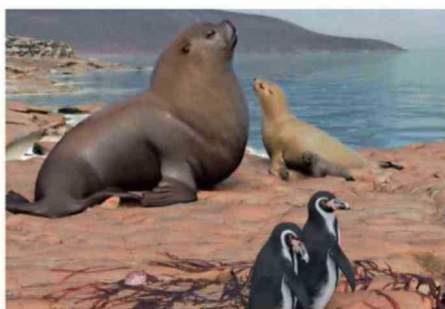
Había más focas que lobos marinos y los pingüinos eran grandes.

Así, confirmó que hasta hace 3 millones de años la temperatura del mar super-