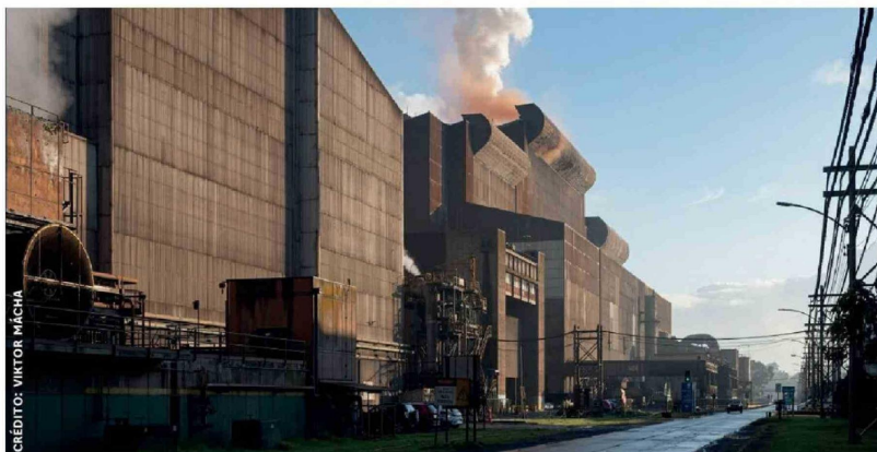
ECONOMISTAS ADVIERTEN que el motor industrial está agotándose y una nueva economía se instala sin generar empleos formales suficientes.

Por ahora, las cifras muestran una realidad clara: más personas trabajando sin contrato y más dificultades para encontrar empleo formal.