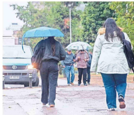
FALTA DE EMPLEO COMPLICARÁ EL INVIERNO A FAMILIAS.