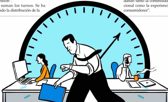
FRANCISCO JAVIER OJEDA