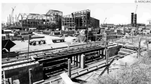
En 1967 se construía en Cocharcas, en Ñuble, la planta de N° 4 de Iansa. Hoy es la única que continúa operativa.

También ha trascendido que los funcionarios de la empresa que tienen relación con el área agrícola de remolacha serán desvinculados una vez que termine la cosecha en curso, principalmente asesores técnicos y el área de insumos agrícolas, quienes ya habrían sido avisados.