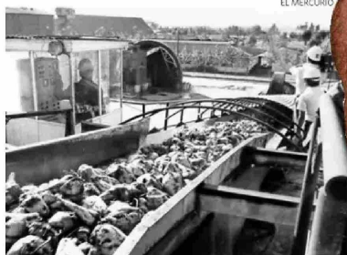
Camiones a la espera de descargar su remolacha en la planta de Iansa en Curicó, en 1985.

Se trata de la primera vez desde la creación de la Industria Azucarera Nacional por parte de Corfo en 1953 que la compañía no utilizará remolacha nacional para la producción