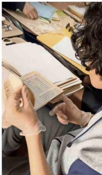
EL ARCHIVO PARTICIPARÁ POR PRIMERA VEZ EN LA CELEBRACIÓN DEL DÍA DEL PATRIMONIO.

entre las 11 y 13 horas, el archivo escolar del Liceo Santa María La Blanca participará en el Día del Patrimonio con una exposición fotográfica en el contexto de la actual labor documental.