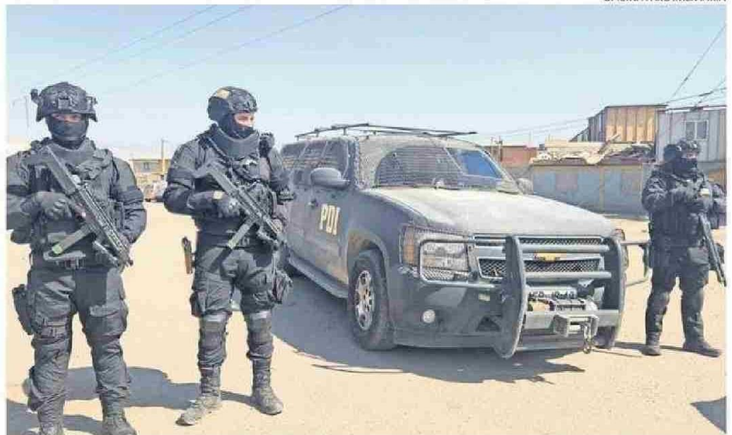
HALLAZGO DE CADÁVER SE REALIZÓ EL PASADO JUEVES.

“Esto es lo que está pasando en Cerro Chuño. A mí no me sorprendería que, cuan-