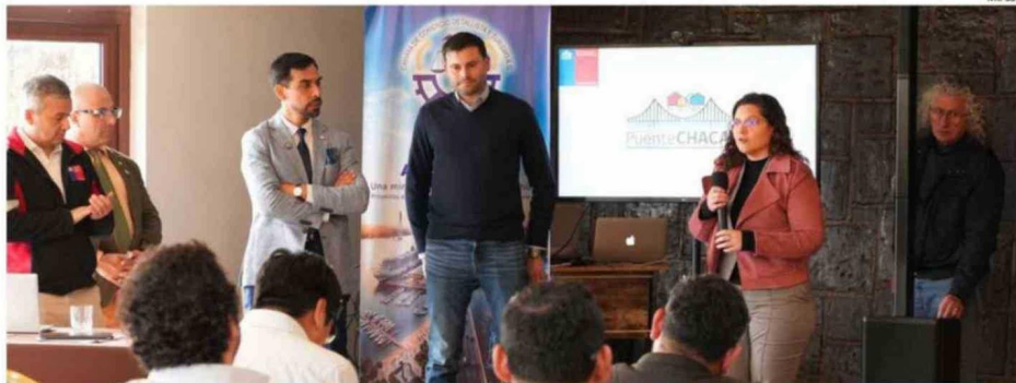
EL MOP PRESENTÓ LA CARTERA DE PROYECTOS DEL MINISTERIO PARA LA COMUNA Y LA PROVINCIA.