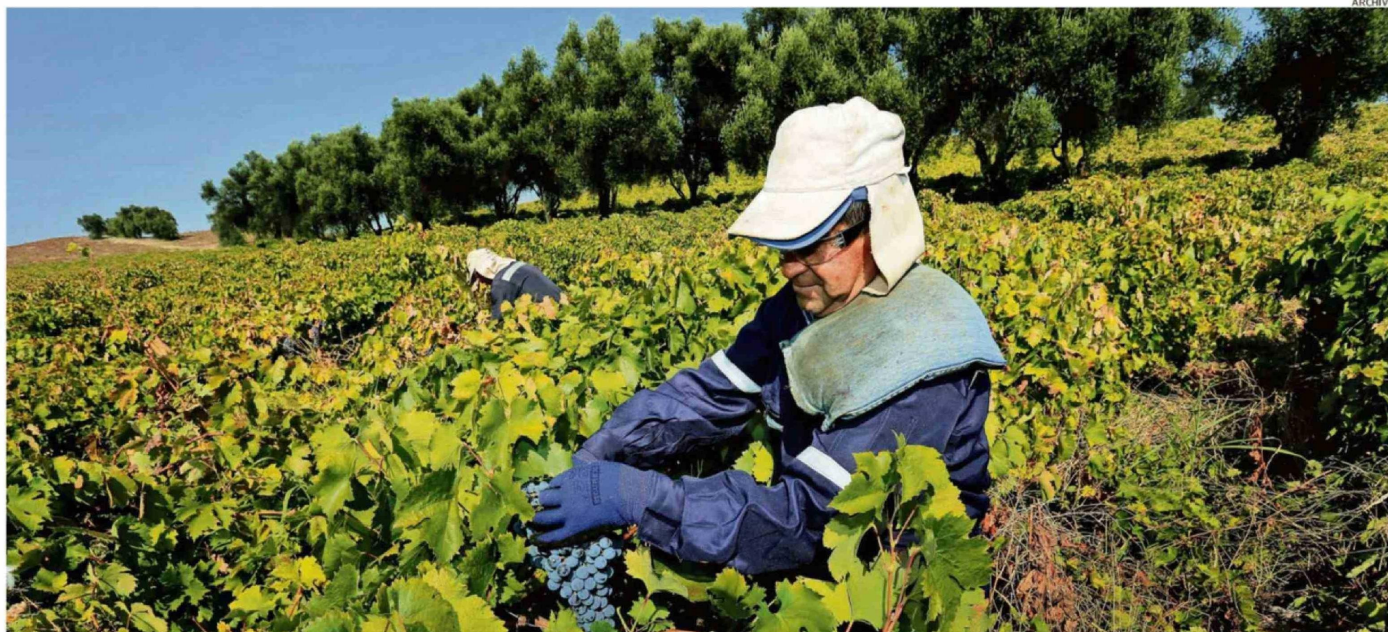
EL SECTOR VITIVINÍCOLA DE ÑUBLE FORTALECIÓ SU PRESENCIA EN MERCADOS INTERNACIONALES, CONSOLIDANDO EL TRABAJO DE VIÑAS LOCALES Y SU PROYECCIÓN EXPORTADORA.