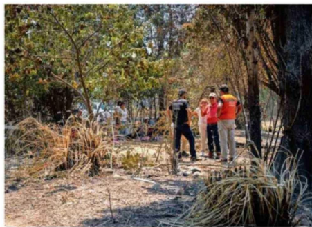
LOS INCENDIOS TAMBIÉN AFECTARON A PRODUCTORES DE VINO.

de 2025, las exportaciones de vinos aumentaron un 34,4%, reforzando la tendencia al alza observada durante el segundo semestre del período analizado.