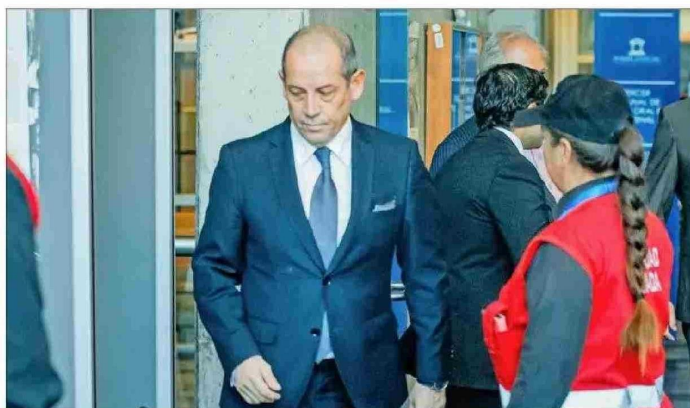
Un total de 701 páginas tiene el capítulo del expediente que analiza las filtraciones de Sergio Muñoz a Luis Hermosilla, pero en total son más de 700 mil páginas de comunicaciones.

La mensajería fue recuperada del teléfono del penalista y es parte del expediente del caso, que dejó al jefe policial en prisión preventiva este martes. La fiscalía, ahora, comienza una segunda etapa en la indagatoria para verificar si hay más funcionarios públicos involucrados en este tipo de filtraciones.