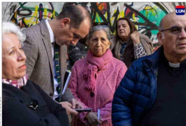
Los vecinos del sector San Borja quieren volver al templo.

Carabineros. Tiene casi 3 mil metros cuadrados de terreno y cerca de mil metros cuadrados. En su interior existieron históricos vitrales elaborados por el Atelier Dagrand de Burdeos, considerados los vitrales firmados más antiguos registrados en Chile. Parte de ellos lograron ser rescatados y permanecen resguardados para una futura reinstalación.