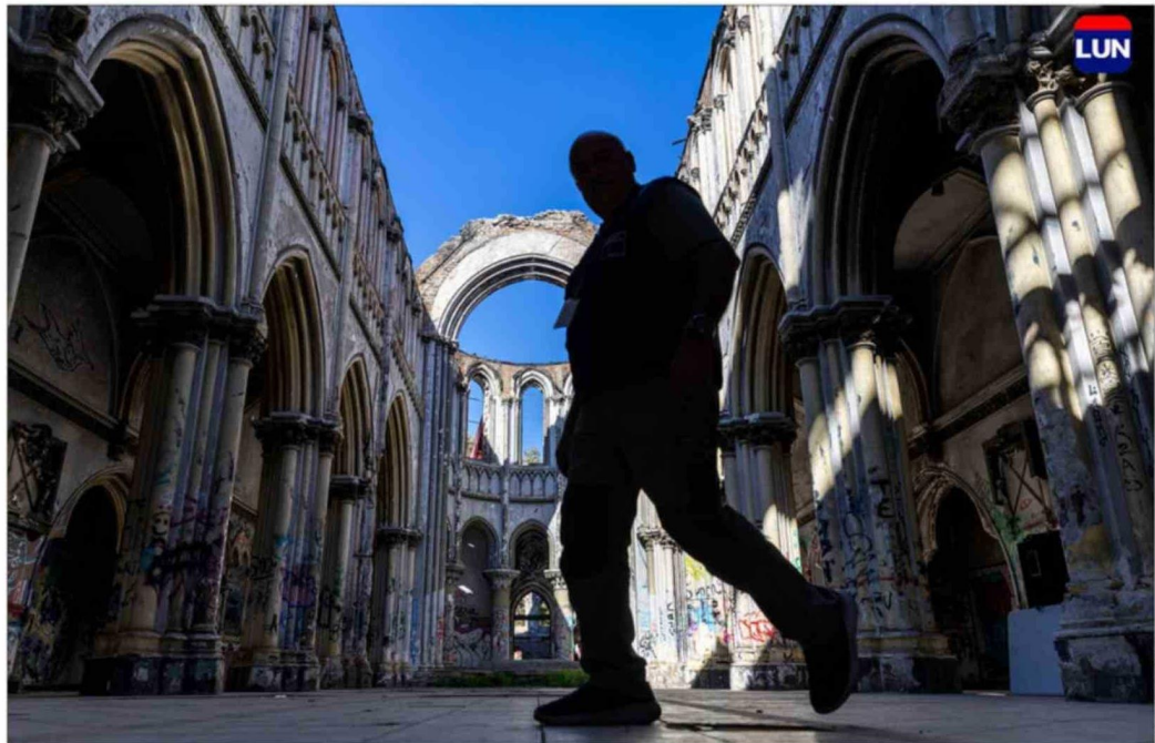
La iglesia fue construida en 1872.

La Iglesia San Francisco de Borja fue construida en 1872 como capilla del antiguo Hospital San Borja y luego quedó bajo administración de