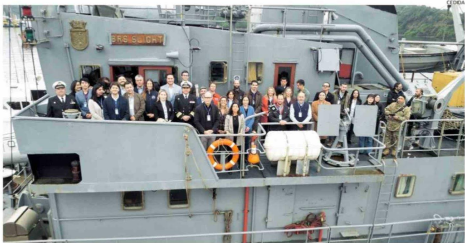
EN UN BUQUE DE LA ARMADA SE REALIZÓ PARTE DE LA JORNADA EN QUE SE EXPLORÓ LA ECONOMÍA AZUL EN LOS LAGOS.