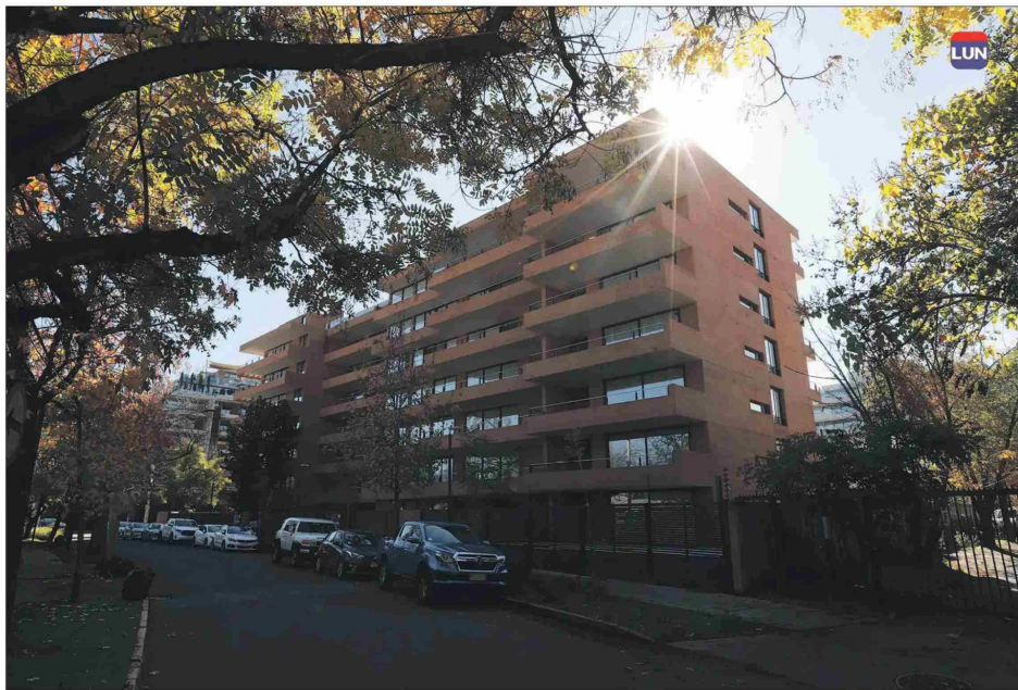
El inmueble está a pasos del circuito gastronómico de Nueva Costanera.

Es la propiedad con mayor descuento del evento y se ubica en un edificio a tres cuadras del Parque Bicentenario.