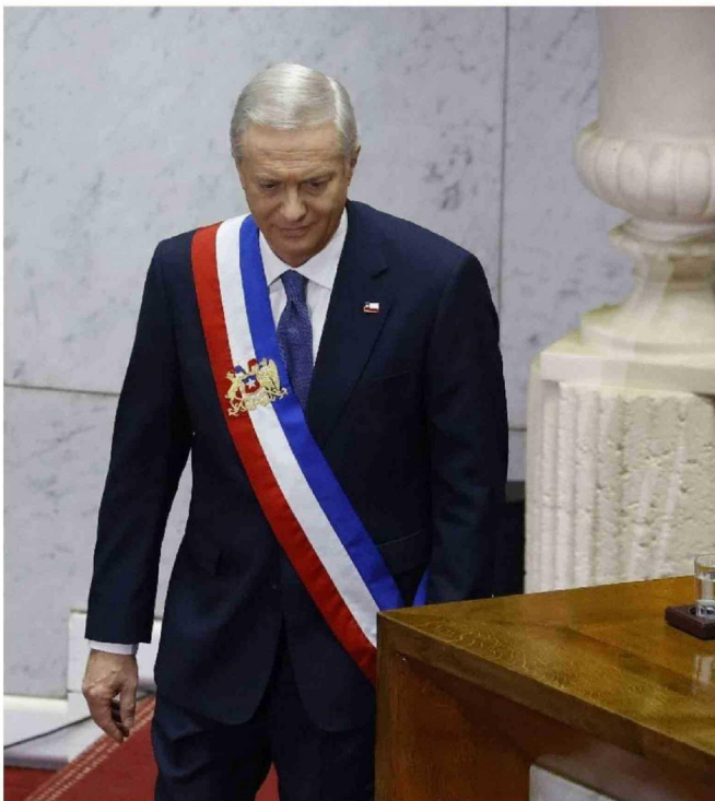
► En general no hubo mayores interrupciones en la alocución.