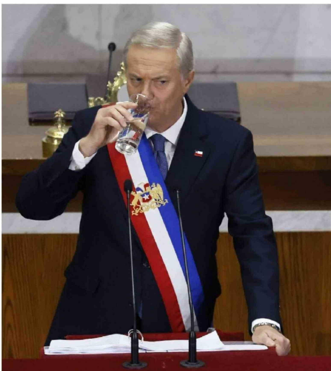
► También hubo anuncios en cuánto a fusión de ministerios.