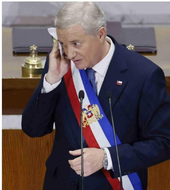
► Los 144 minutos del discurso lo ubican en un tiempo de duración promedio.