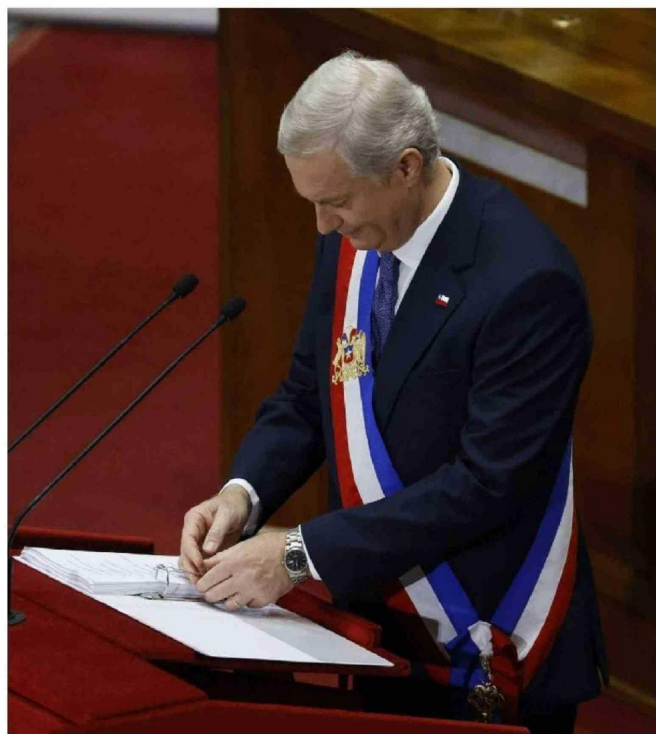
► El Presidente también dio a conocer nuevos bonos.