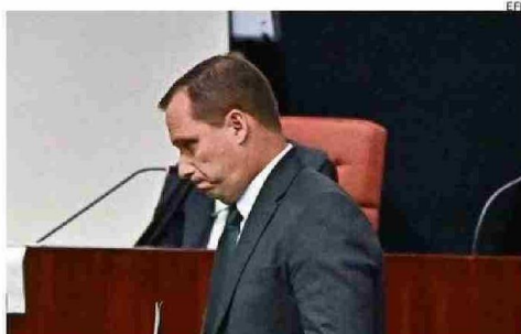
MAURO CID, EX EDECÁN DE BOLSONARO.