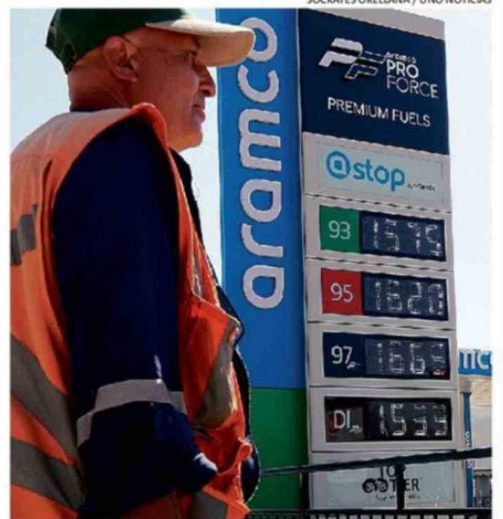
SÓCRATES ORELLANA / UNO NOTICIAS