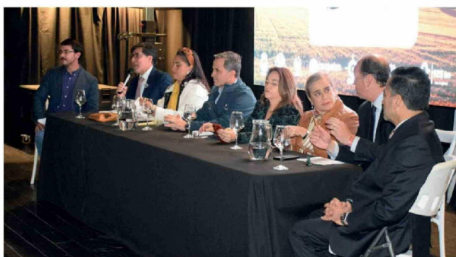
DURANTE LA JORNADA se abordaron medidas de prevención, coordinación institucional y desafíos para el mundo rural.