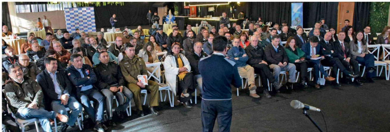
EL SEMINARIO "Desafíos de Seguridad para el Sector Rural del Biobío" congregó a autoridades y representantes del ámbito agrícola y de seguridad en dependencias de Socabio.

Título: Biobío impulsa diálogo sobre seguridad rural en la provincia