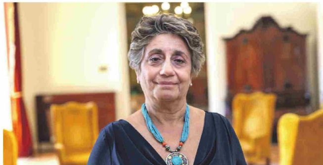
Este 6 de febrero, regantes de Combarbalá se reunirán con la ministra de Obras Públicas, Jéssica López.

Con 40 acciones de agua que tres regantes mayoritarios no habrían cedido, condición clave para que el Estado invirtiera US$81 millones en la construcción del embalse Valle Hermoso, obra destinada a asegurar el consumo humano de agua para cerca de 30 localidades rurales de la comuna.