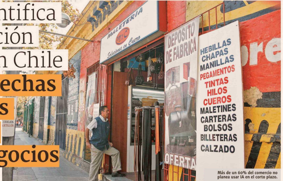
Más de un 60% del comercio no planea usar IA en el corto plazo.

Un estudio de la CNC observó que más de un 60% de las empresas de mayor tamaño tiene un nivel de digitalización alto, mientras que en las micro no supera el 40%. Lo mismo ocurre con el uso de IA y el acceso a tecnología.