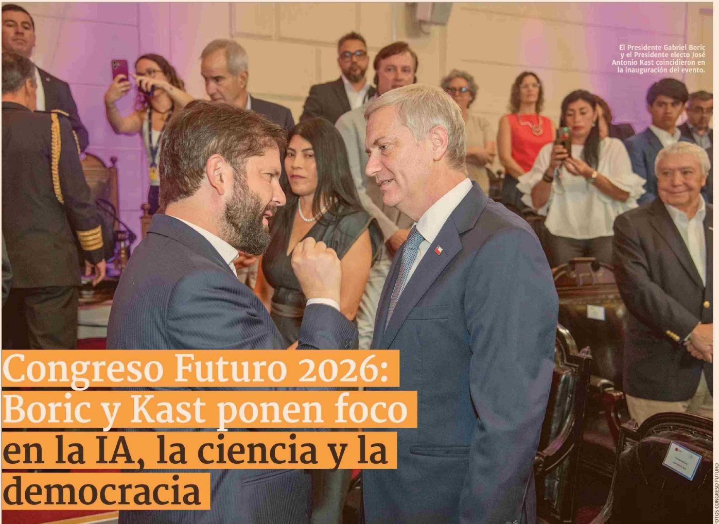
El Presidente Gabriel Boric y el Presidente electo José Antonio Kast coincidieron en la inauguración del evento.

Título: Congreso Futuro 2026: Boric y Kast ponen foco en la IA, la ciencia y la democracia