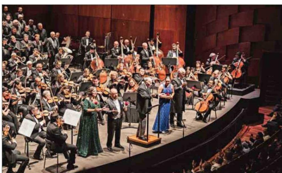
La Orquesta Sinfónica Nacional de Chile regresará a la cita con dos conciertos, el lunes 2 y miércoles 4 de febrero.