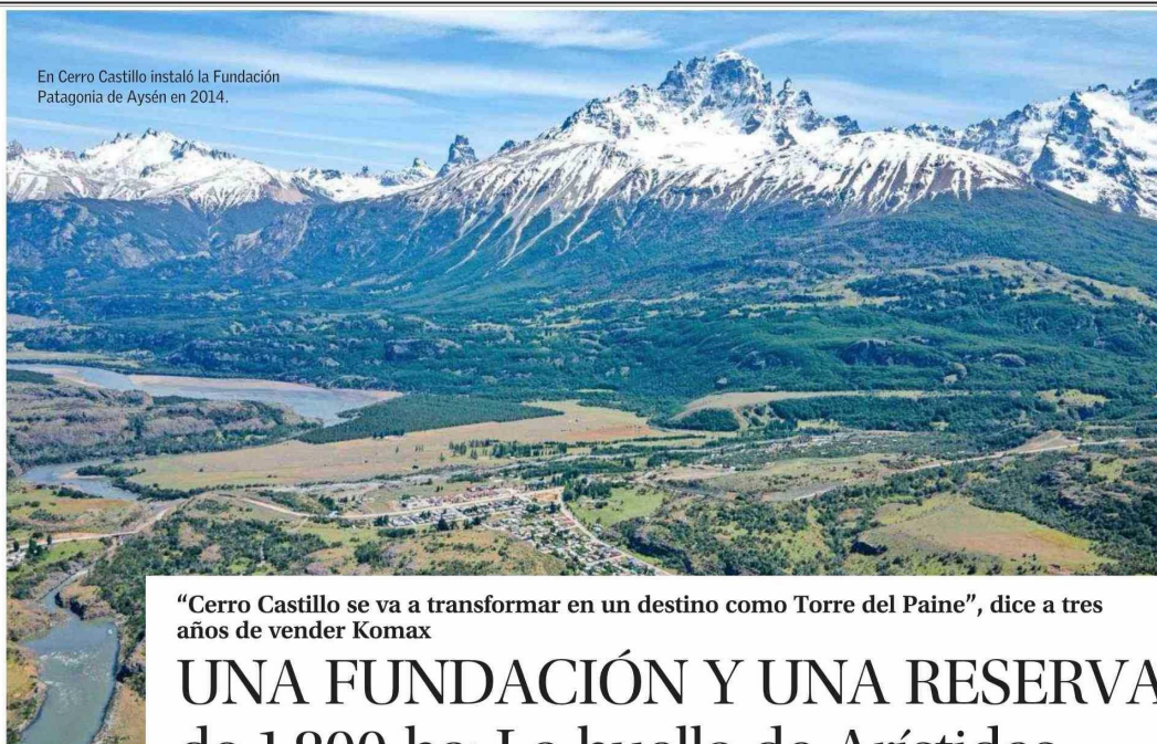
En Cerro Castillo instaló la Fundación Patagonia de Aysén en 2014.