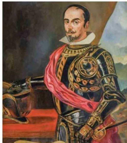
MARTÍN RUIZ DE GAMBOA, QUIEN FUNDÓ SANTIAGO DE CASTRO EN 1567.

Por lo anterior, el Tratado de Tantauco además de propiciar el desarme de las milicias y de asegurar que los habitantes de Chiloé “gozarán de la igual-