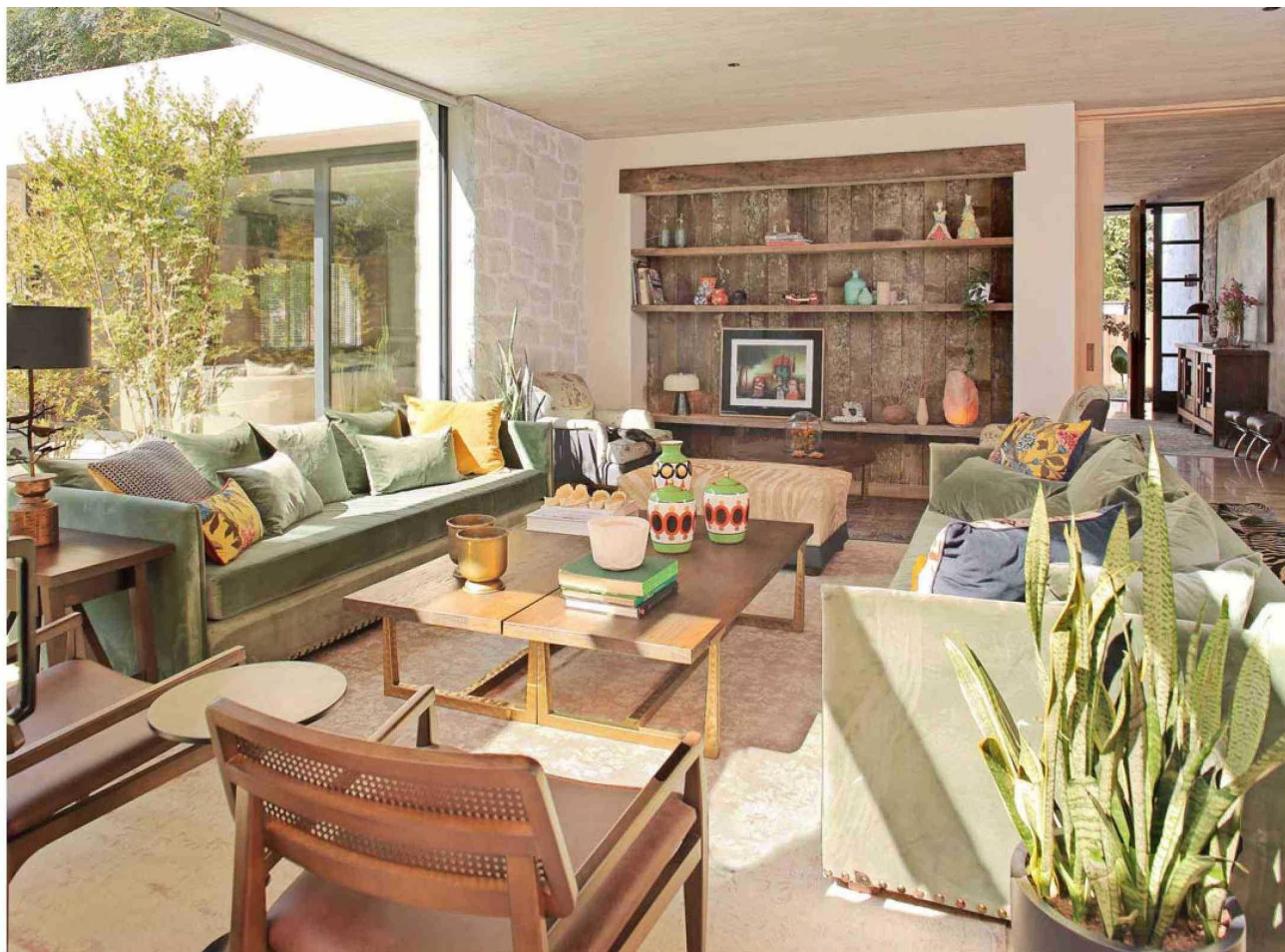
La estética e identidad del living está dada por el revestimiento de madera que trajeron del sur. Su relación con la piedra es fluida.

Tiraje: 126.654 Lectoría: 320.543 Favorabilidad: No Definida