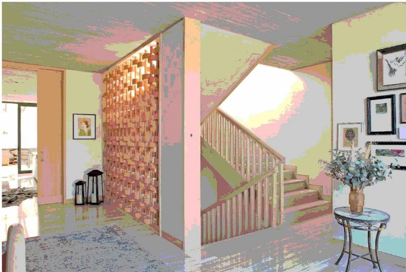
La excepcional celosía junto a la escalera de fresno y mármol, que conecta los tres niveles, fue diseñada con piezas cerámicas.

Tiraje: 126.654 Lectoría: 320.543 Favorabilidad: No Definida