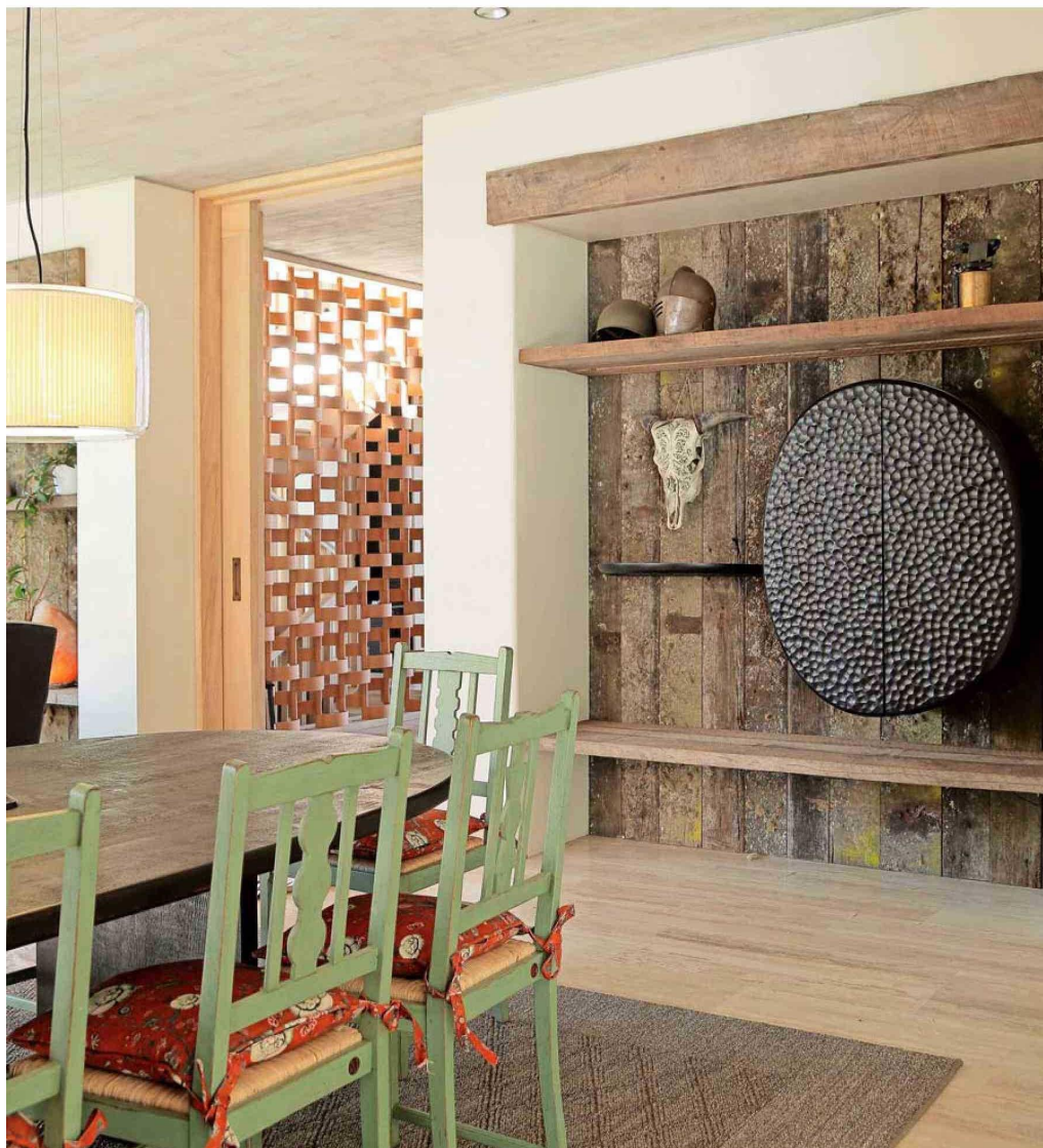
Incorporado al mueble en obra, destaca un bar colgante, ejecutado en madera por Runa Design.

Texto, Jimena Silva Cubillos. Producción Paula Fernández Tagle.