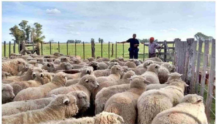
Marzo da cuenta de un escenario marcado por variaciones productivas y desafíos del sector pecuario regional.

En este contexto, el desempeño del sector durante los próximos meses será clave para evaluar la evolución de la actividad pecuaria en Magallanes,