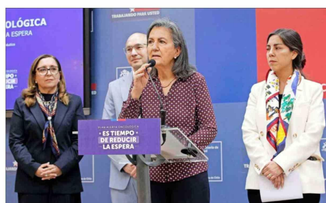
MEDIDA — La alerta oncológica, vigente desde mediados de abril, será uno de los puntos clave en el discurso del mandatario. Se busca acelerar la atención retrasada de más de 33 mil pacientes.

anunciado en primera instancia, si equivale a más de $417 mil millones, un 2,5%. Por lo mismo, una de las preocupaciones es la situación presu-