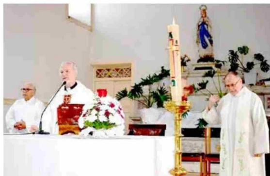
Obispo de la Diócesis de Talca, monseñor Galo Fernández, ofició la Eucaristía para dar inicio al año académico.