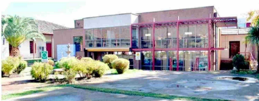
Biblioteca del Centro de Formación Técnica San Agustín Talca.

POR MARÍA FRANCISCA GARCÍA BASCUÑÁN