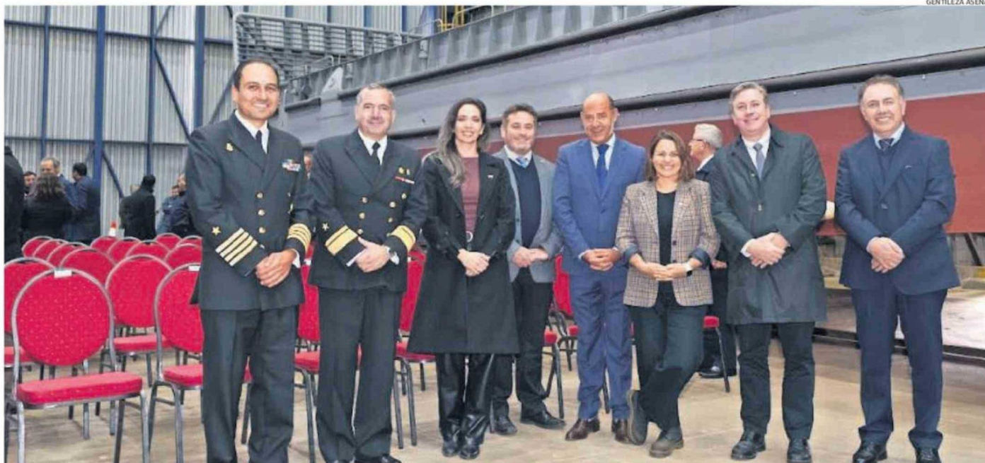
ASENAV MATERIALIZÓ LA ENTREGA DE LAS BARCAZAS DE DESEMBARCO SELKNAM Y MANUTARA. AUTORIDADES Y EMPRESA COINCIDEN EN IMPORTANCIA DEL APOORTE VALDIVIANO A LA NUEVA POLÍTICA NAVAL.