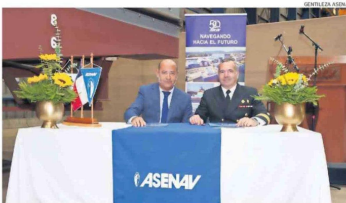
GERENTE GENERAL DE ASENAV DESTACÓ LA COLABORACIÓN PÚBLICO PRIVADA.