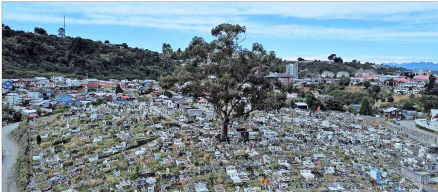
PUERTO MONTT. — Completamente colapsado está el cementerio en Población Modelo, que no tiene espacio para seguir creciendo en medio de la ciudad. “No hay dónde caerse muerto”, bromean cuidadores y estacionadores de autos.

Traslados, exhumaciones y reordenamiento de nichos son algunos de los paliativos para enfrentar la difícil situación en los camposantos.