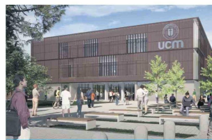
Nuevo Campus Santa Mónica (Curicó)